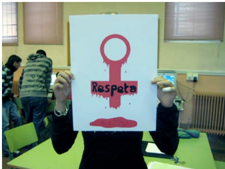
Parte-hartzaile bat bere collage-a erakusten.