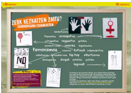
Lantegitik ateratako eta aldizkarian argitaratutako behin betiko edukiak.

PKTexpres es lantegiak Gasteizko Udalaren lantegi-programan kokatzen dira. Bertan sortzen diren eztabaidek eta edukiak PKTenteres aldizkariaren edukiak osatuko dituzte.