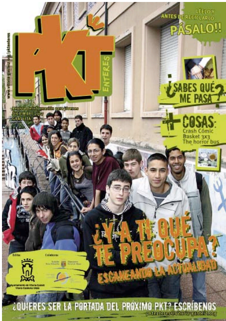
2007ko abenduako azala.