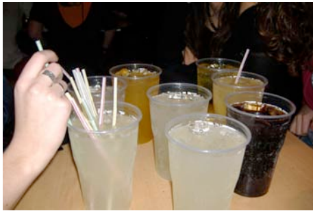
Diario de consumo un fin de semana.

“no nos consideramos consumistas, tal vez porque no tenemos más dinero”