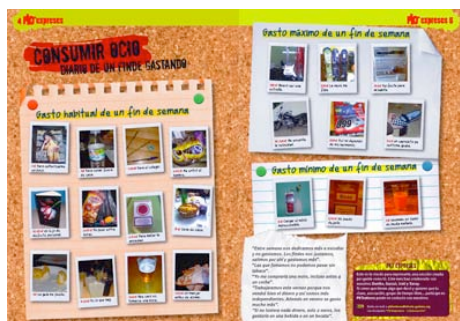
Contenido final en la revista derivado del taller.

Los talleres PKTexpreses forman parte de un programa del ayuntamiento de Vitoria-Gasteiz. Los debates y contenido que se generan en los talleres forman parte del contenido de la revista PKTenteres.