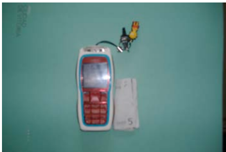
Diario de consumo un fin de "mínimos".

"Valoramos el dinero en medida de que somos conscientes de que sin dinero no puedes hacer nada, pero hay cosas que si no las tenemos no pasa nada. Probablemente porque nuestras necesidades las tenemos cubiertas por la familia"