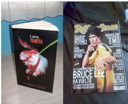
Diario de consumo un fin de semana.

“no nos consideramos consumistas, tal vez porque no tenemos más dinero”