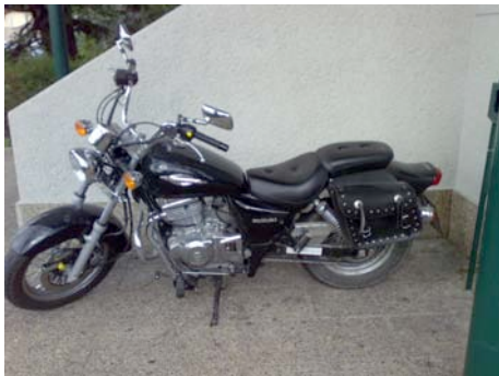
Diario de consumo de “máximos”.

Algunas de las participantes tienen relación con la OMIJ, nos parece interesante tomar este lugar como punto de encuentro.