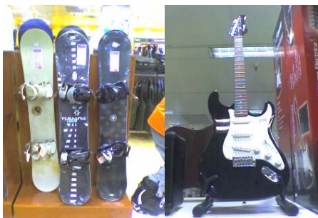
Diario de consumo un fin de "máximos".

"Valoramos el dinero en medida de que somos conscientes de que sin dinero no puedes hacer nada, pero hay cosas que si no las tenemos no pasa nada. Probablemente porque nuestras necesidades las tenemos cubiertas por la familia"