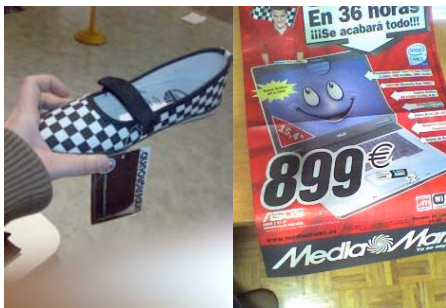
Diario de consumo un fin de “máximos”.

“Valoramos el trabajo. En el fondo nos parece mucha cara estar pidiendo todo el día dinero a los padres. Generalmente si queremos algo (más caro) que se sale de nuestras posibilidades, esperamos a navidades, cumpleaños o alguna fecha especial”.