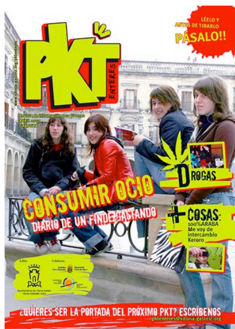
Portada de PKT abril 2007.