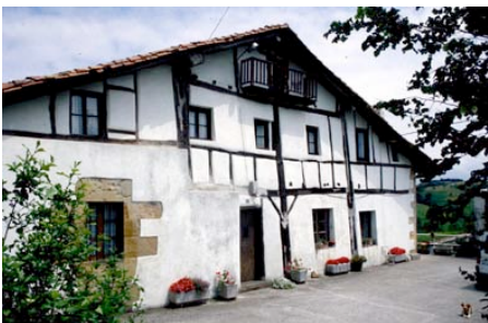
Respuesta pregunta nº 20.

La colaboración para la revista (PKTenteros) y la naturaleza de la misma se definió como un pasatiempo que plantear a los/as lectores/as. El lector debería vincular las imágenes publicadas con cuatro preguntas diferentes que fueron con cuyas respuestas más se identificaban a los/as punteros que asistieron a las sesiones del taller.