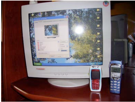
Respuesta pregunta nº 15.