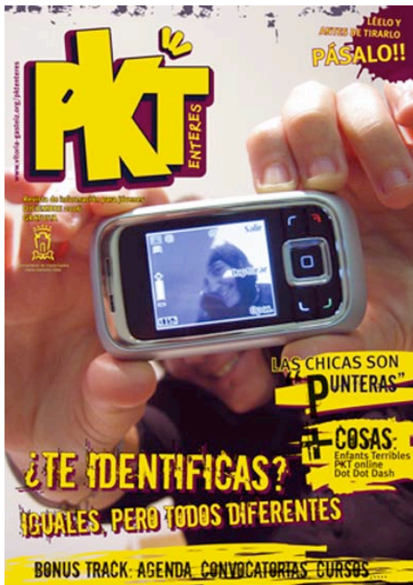
Portada de diciembre 2006.

Los talleres PKTexpres forman parte de un programa del ayuntamiento de Vitoria-Gasteiz. Los debates y contenido que se generen en los talleres formarán parte del contenido de la revista PKTenteres.