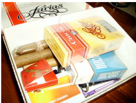
Respuesta pregunta nº 14.

La imagen de la habitación, es una de las respuestas más similares entre el grupo de participantes.