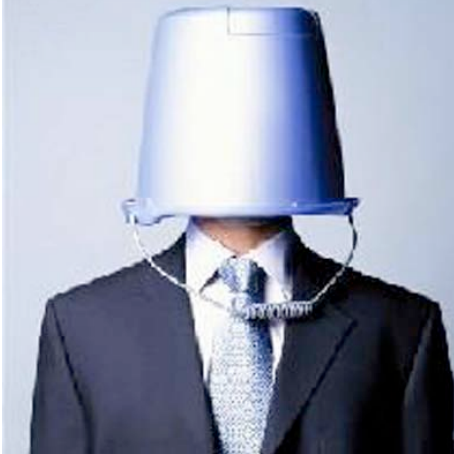
Respuesta pregunta nº 13 .