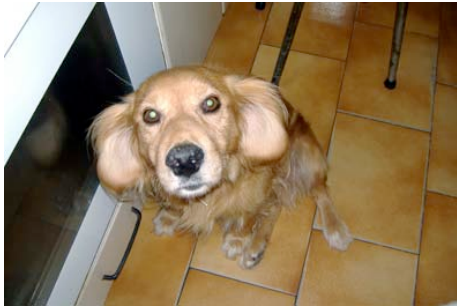
Respuesta pregunta nº 4.

Hay necesidad de marcar diferencias con aquellos gustos que no son de su agrado y con quienes pertenecen a esos perfiles por los que muestran rechazo.