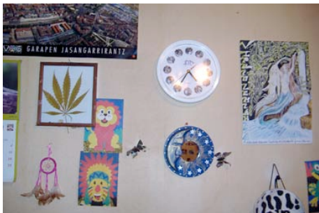
Respuesta pregunta nº 1.

Hay necesidad de marcar diferencias con aquellos gustos que no son de su agrado y con quienes pertenecen a esos perfiles por los que muestran rechazo.