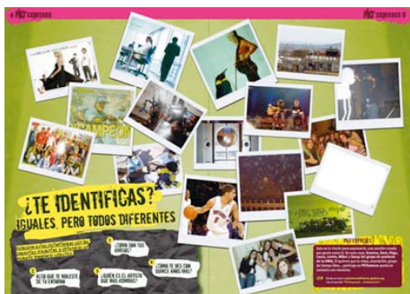
Contenido final en la revista derivado del taller.

Los talleres PKTexpres forman parte de un programa del ayuntamiento de Vitoria-Gasteiz. Los debates y contenido que se generen en los talleres formarán parte del contenido de la revista PKTenteres.